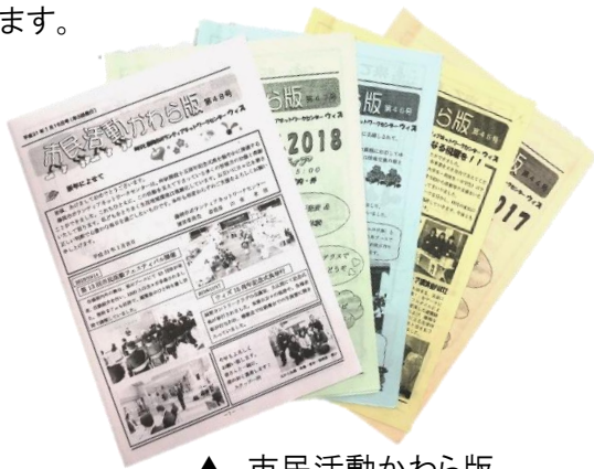
▲ 市民活動かわら版

イベント開催案内、活動メンバー募集、ボランティア募集、助成金案内等のお知らせをセンターに掲示。「情報発信したい」「情報収集したい」どちらにも対応できます。