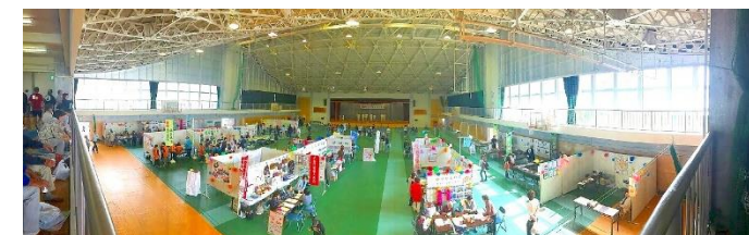
▲ 市民活動フェスティバル会場の様子