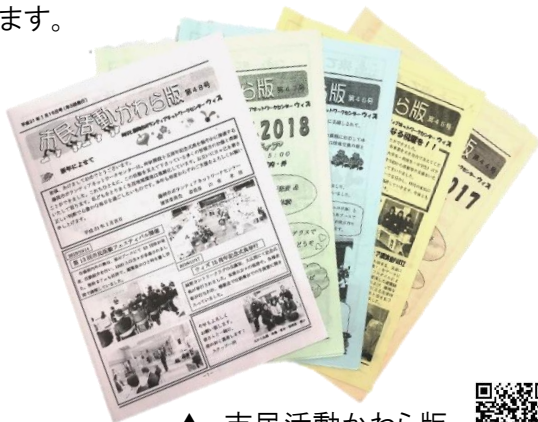
▲ 市民活動かわら版

イベント開催案内、活動メンバー募集、ボランティア募集、助成金案内等のお知らせをセンターに掲示。「情報発信したい」「情報収集したい」どちらにも対応できます。