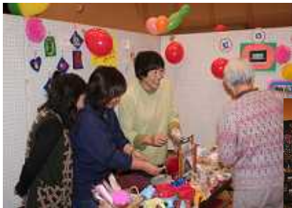
～趣向を凝らした ステージ・展示のようす～