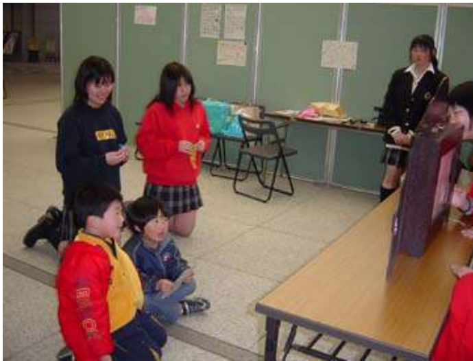
紙芝居を使って子どもに環境について 教えている様子

私が所属している「キッズエコプロジェクトチーム」の主な活動は、地域の子どもたちに歌やゲームなどを通して環境に対する意識を高めてもらおうことです。