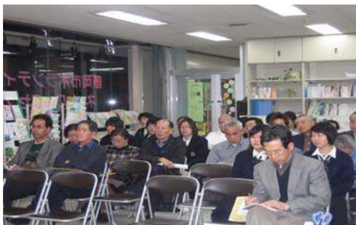
真剣に話を聞く参加者

対談は、楽しい雰囲気の中で行われ、活動のきっかけや活動を通じての感想、また、ボランティアとは何かといった深い内容まで踏み込んだ話になり、参加者は、若い人のボランティア感について、熱心に耳を傾けていました。