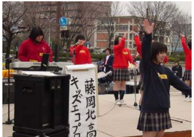
環境についての知識を ダンスで伝えている様子