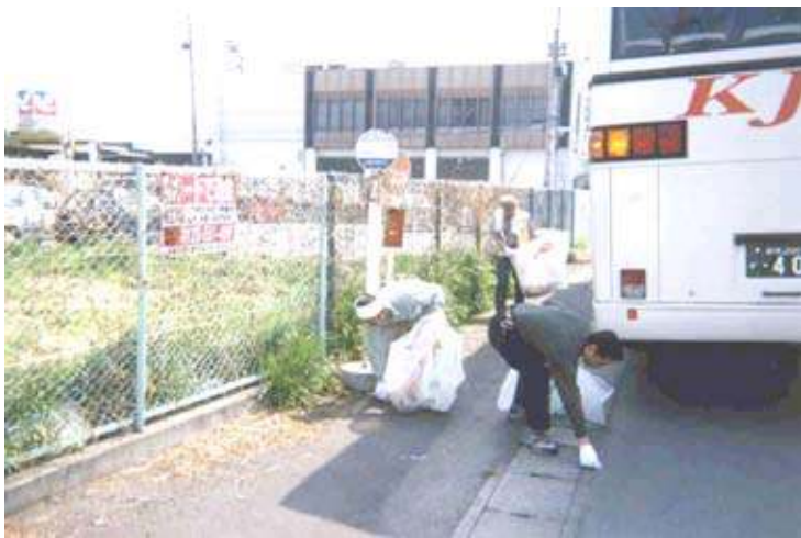
（市内での空き缶拾い）

こうした活動は、会社としてごく当たり前の行動であり、特に企業の社会貢献活動という位置づけで始まったものではありません。今後も労使一体となって、企業ボランティアへのきっかけづくりとなるような活動を継続し、新たな取り組みにも挑戦して行きたいと考えています。