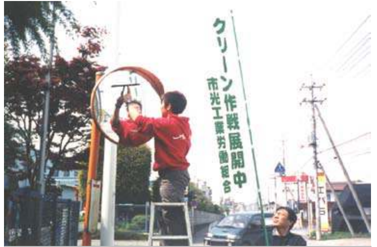
（労使によるカーブミラー清掃）

藤岡地区で1980年頃から実践しているのが、労使による地域クリーン作戦です。年2回実施しており、全従業員に呼びかけ、毎回約70人が参加します。市内全域を対象とし、5人1組で、カーブミラーの清掃及び空き缶拾いを行います。清掃作業中に、地域の方から差し入れをいただくこともあり、コミュニケーションを図る機会にもなっています。